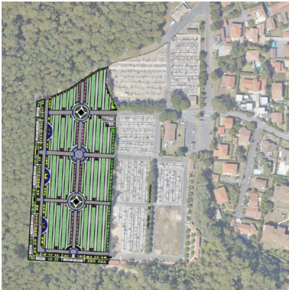
Figure n°3 : Parti d'aménagement du site

Selon le parti d'aménagement du projet, plusieurs espaces végétalisés accueilleront des strates végétales de différentes hauteurs. Ainsi, plus de 282 arbres, dont certains atteindront une hauteur de huit à neuf mètres, seront plantés sur l'ensemble de l'opération, soit plus de 70 sujets supplémentaires par rapport à la population actuelle de pins présente sur l'emprise du projet.